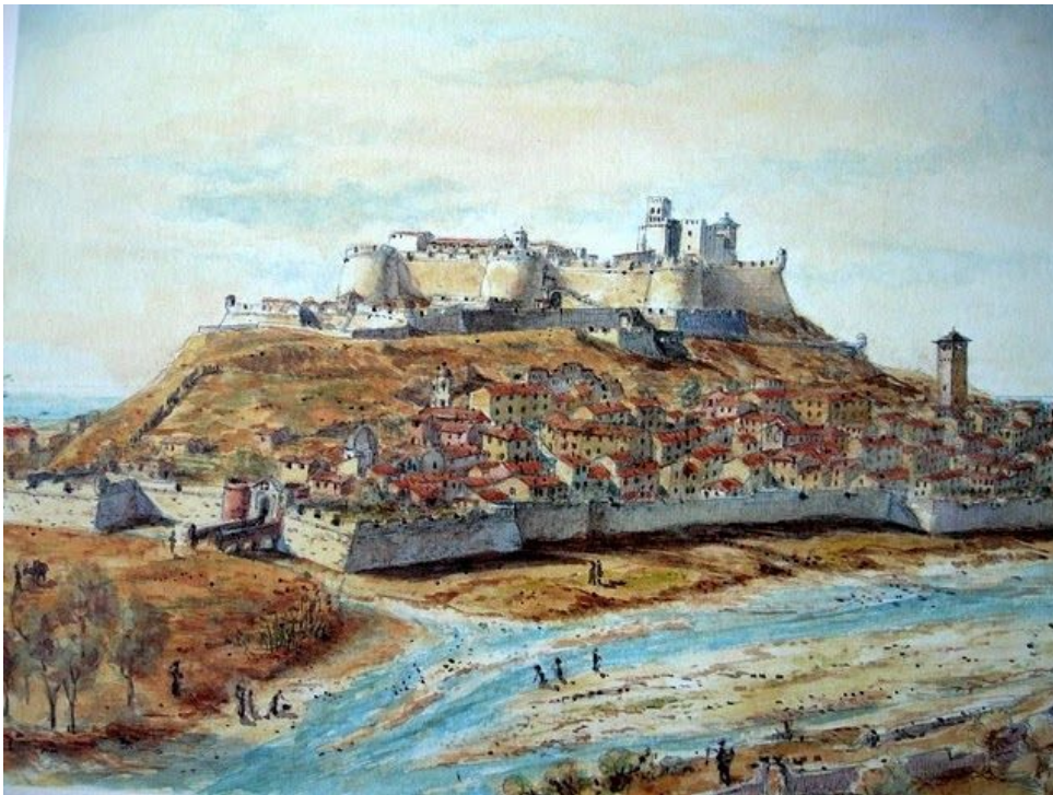
Siège de Nice

François d'Aubusson – Duc de la Feuillade – Maréchal sous Louis XIV