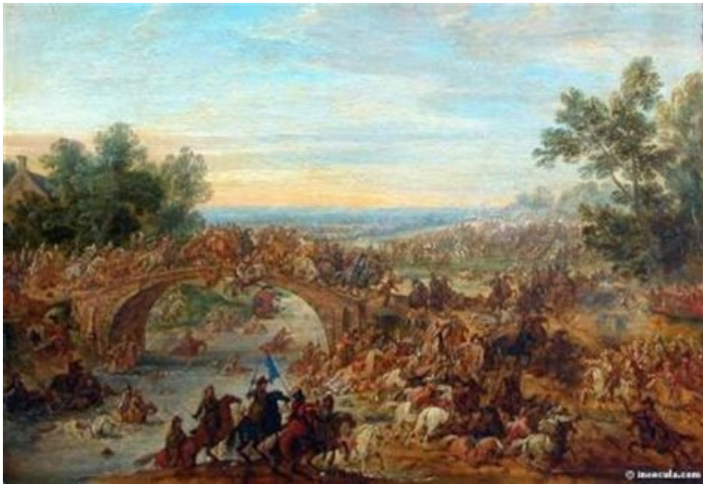
Guerre de Hollande 1672 / 1678

Jean Thomas de Bérulle suivit une formation militaire. Dès 1675 il est nommé lieutenant du Roy puis capitaine en 1685. Durant sa carrière militaire, il participera à 4 guerres de Louis XIV.