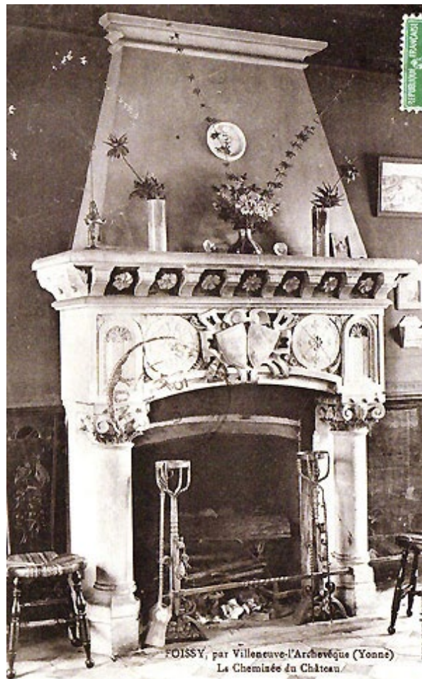
FOISSY, par Villeneuve-l'Archevêque (Yonne) La Cheminée du Château