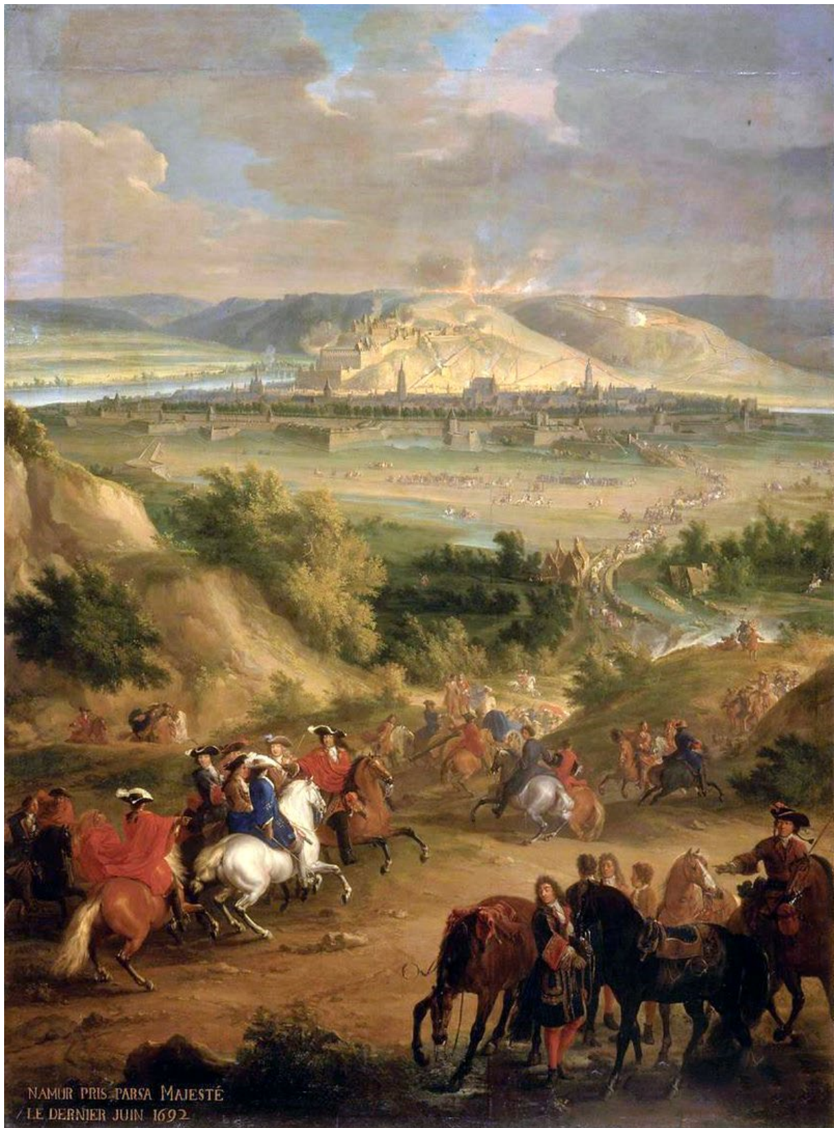
Siege of Namur (1692)